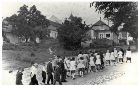
ulice Na kopci 1966

Obec Koberice u Brna archivuje doklady minulosti své a svých občanů tak, aby byly zachovány i budoucím. Obecní úřad Koberice u Brna, se na Vás proto obrací s prosbou o poskytnutí soukromých archiválií, jako jsou dobové fotografie, filmy a různé zápisy z dění v obci, kulturních akcí, včetně předešlých Sjezdů rodáků, nejlépe s datací a popisem. Vámi zapůjčené podklady bychom, po vzájemné dohodě, elektronicky zkopírovali k uložení v obecním archivu a originály Vám vrátili. Tyto materiály budou uchovány a nápomocny např. k uspořádání výstav. S případnými informacemi o zapůjčení a s vlastními materiály se můžete obracet na kancelář OÚ Koberice u Brna. Přispějete k rozšíření obecního archivu, doklady budou „zvěčněny“ a přitom vám zůstanou. Několik fotek dáváme přílohou. Za ochotu předem děkujeme.