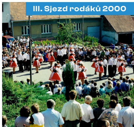
III. Sjezd rodáků 2000