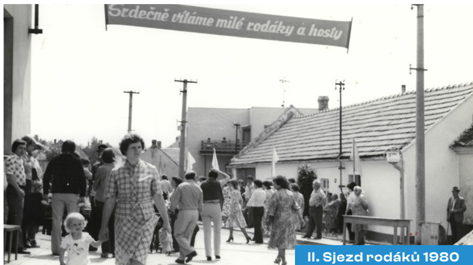
II. Sjezd rodáků 1980