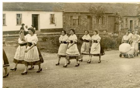
ulice Dolní č.p.90, 64, 65 rok 1961