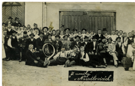
u muziky v Násedlovicích, rok 1913