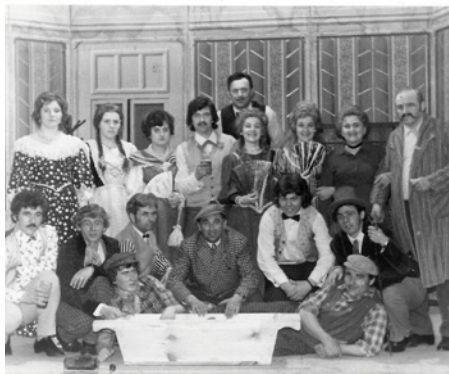
Koberští ochotníci r. 1974