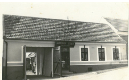
obchod Kašpara Čecha po roce 1925, Vinohrady č. p. 217