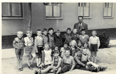
1. a 2. třída, rok 1959