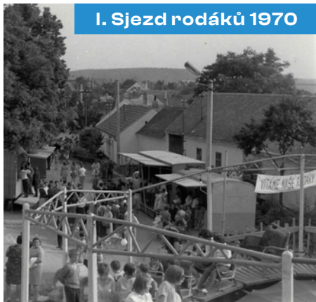
I. Sjezd rodáků 1970

V letošním roce, dá-li Bůh, proběhne v termínech 20. – 22. 6. 2025 sjezd rodáků. Po rocích 1970, 1980, 2000, 2005 a 2010 to bude rok 2025, kdy opět v náhradním termínu, tentokrát za covidový rok 2020, budeme mít v Kobeřicích tuto mimořádnou slavnost. Je to především společenská příležitost k setkání lidí. Rodiny, přátel, známých i méně známých – všech, kteří mají v srdci naši dědinu. Program bude probíhat na návsi, v Sokolovně, na hřišti U lesa a dalších místech v obci. Středem dění bude jistě nově otevřená Sokolovna, na kterou se všichni těšíme.